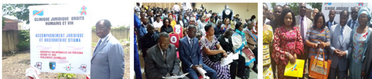
Inauguration de la Clinique Juridique UCOP+_CEDHUC par S.E le Ministre de la Justice