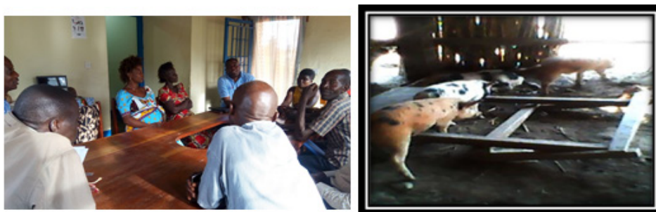
L'autonomisation des PvVIH pour l'auto prise en charge (Nyemba/ Tanganyika)