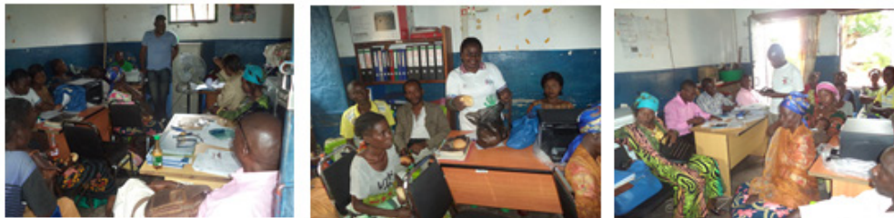
La sortie de la clandestinité des PvVIH et leur accueil dans les groupes de support (Kalemie/Tanganyika)