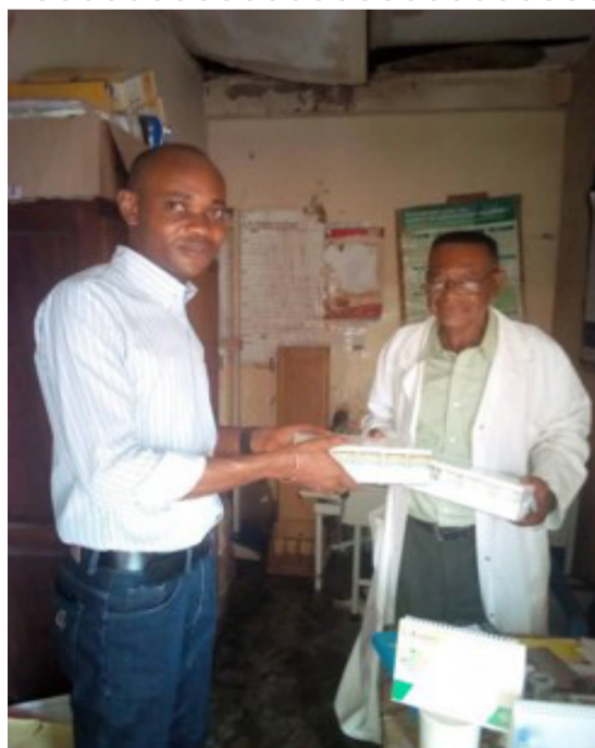
Mbuji-Mayi: Après vérification au CH AENAF, tous les enfants avaient récupéré leurs cures de DUOVIR-N pédiatrique pour le mois de mai et le stock était vide. L'IT n'avait pas placé sa commande au BCZ. Grâce à l'intervention de l'Observatoire, la FOSA a été approvisionnée.