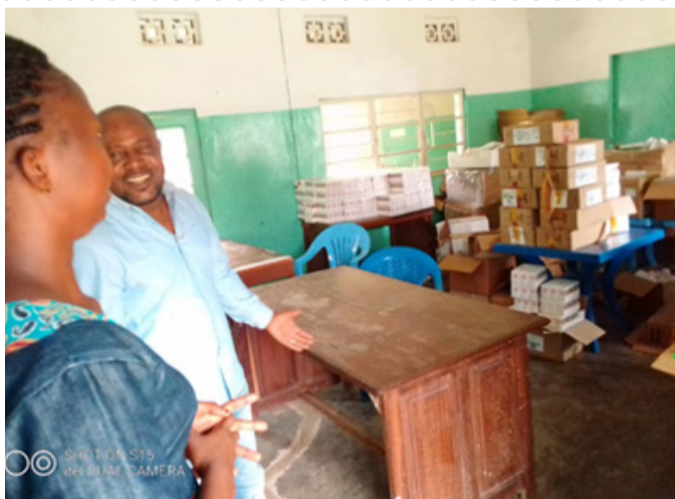
Mbuji-Mayi : Photo prise avant la distribution des ARV pédiatriques