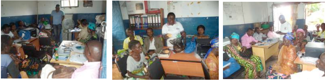
La sortie de la clandestinité des PøVIH et leur accueil dans les groupe de support (Kalemie/Tanganyika)