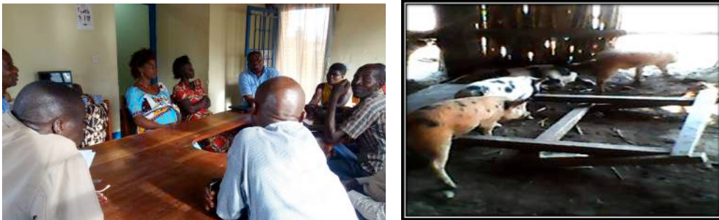
L'autonomisation des PøVIH pour l'auto prise en charge (Nyemba/ Tanganyika)