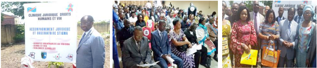
Inauguration de la Clinique Juridique UCOP+_CEDHUC par S.E le Ministre de la Justice