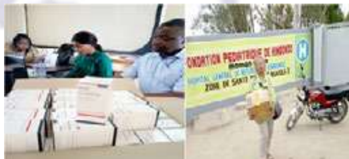
Approvisionnement en médicaments ARV dans une FOSA de Kinshasa par l'équipe OBSERVATOIRE