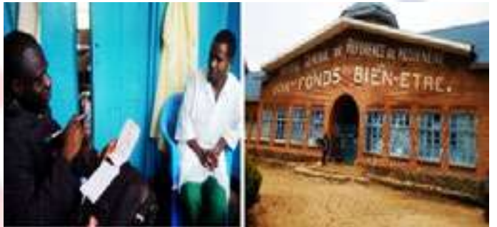
Suivi trimestriel des activités de Enquêteurs : échanges avec l'I.T