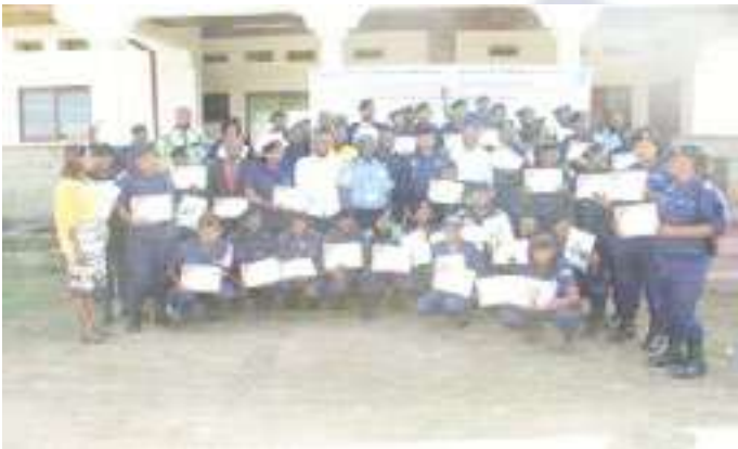
Formation des 45 Officiers Policiers de l'École de la Police de Bunia sur les droits humains, le VIH et le CDV