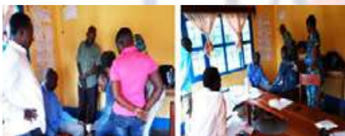
Renforcement des capacités des agents commis au PoDi à Bunia en Ituri