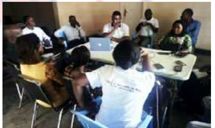
Suivi trimestriel des activités de l'Observatoire à Mbuji-Mayi (Kasaï Oriental)