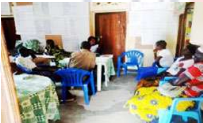
Mission de suivi à la ZS d'Adja/Territoire