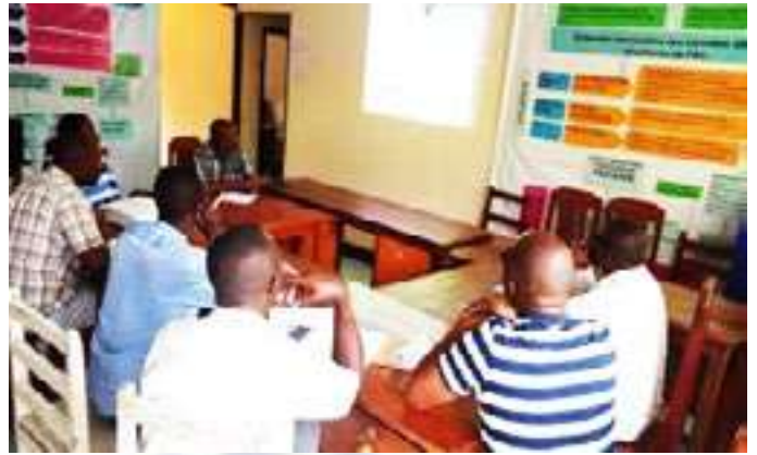
Réunion du CoPil Provincial pour analyse et validation