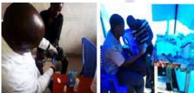
Box de prélèvement pour le CDV