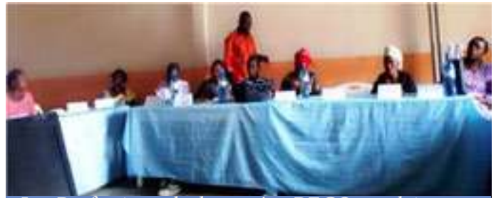
Les Professionnels de santé et RECO an plein renforcement des capacités avec l'Expert du PNLS dans l'approche