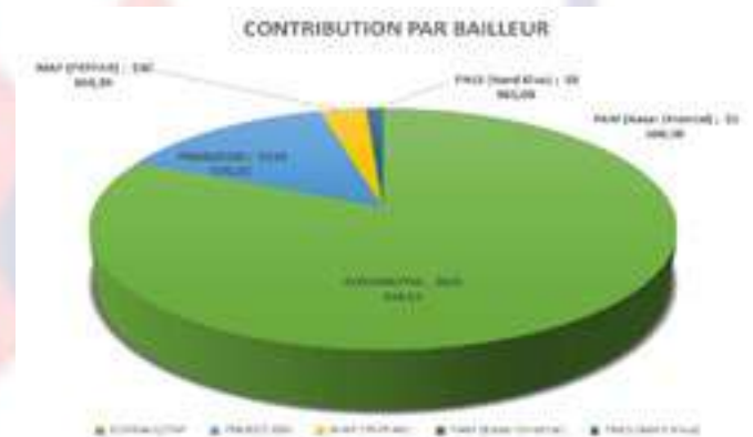
Graphique 1 : Budget par source de provenance

C'est avec un budget annuel de 1 161 747,638 USD qu'UCOP+ a pu réaliser ces activités. Le gros de ce budget provenant, bien entendu, des partenaires extérieurs (voir Graphique 1). UCOP+ a des comptes spécifiques pour chaque projet et chaque bailleur ; de même pour chaque coordination provinciale. Deux logiciels comptables « TOMPRO » et « ATLAS » sont utilisés pour la tenue de la comptabilité.