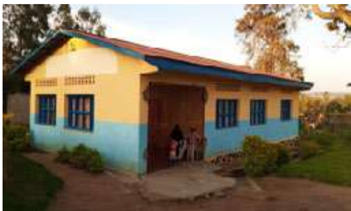
Vue de la maison qui abrite le PoDi à Bunia en Ituri pour les patients VIH stables