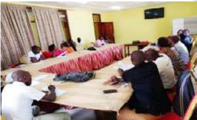
Atelier de formation et de recyclage des Enquêteurs-Pool Goma